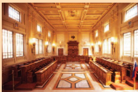
SALA "ADELE BEI" Provincia di Pesaro e Urbino