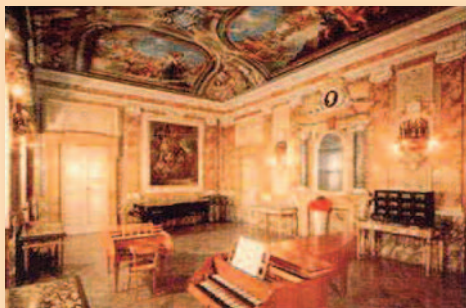
SALA DEI MARMINI Conservatorio Statale di Musica "G. Rossini"